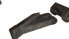
Mancais do cabeçote